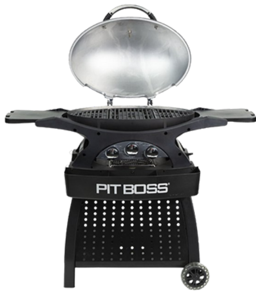
PIT BOSS SPORTSMAN 3 BURNER