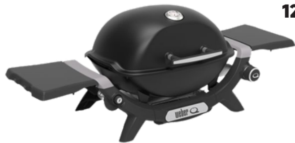
WEBER Q 1200 N