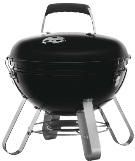
KETTLE HOUTSKOOL 36 X 36 X 39 CM