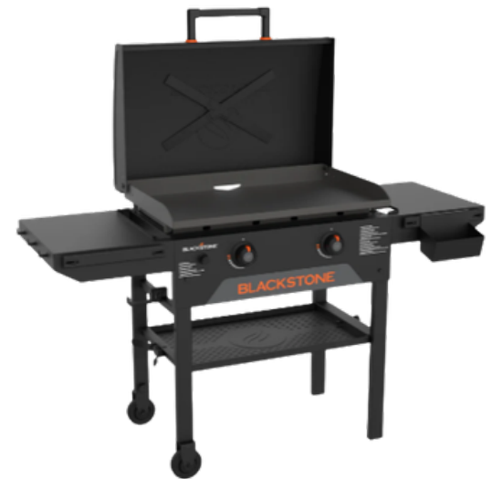
ORIGINAL 71 CM GRILL