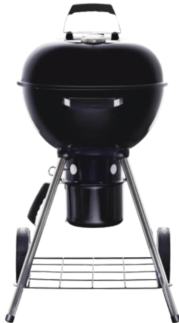
KETTLE HOUTSKOOL 53 X 62 X 89 CM