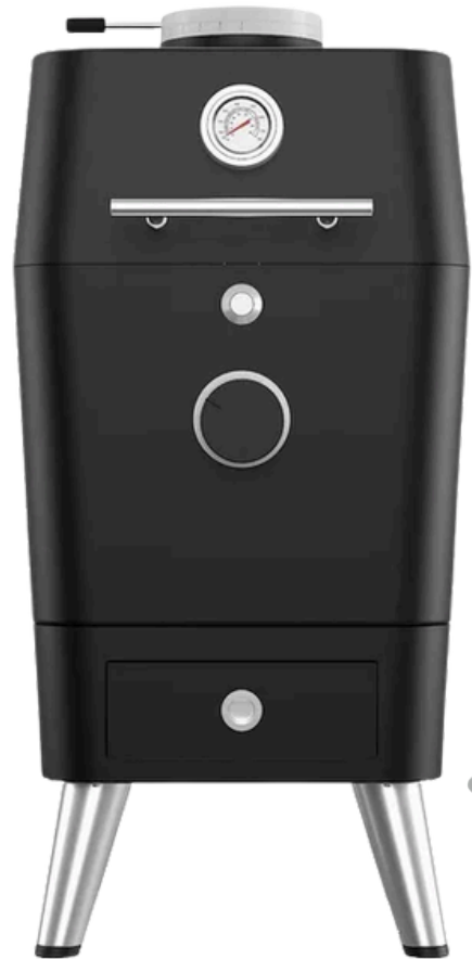
K1 70 X 50 X 147 CM