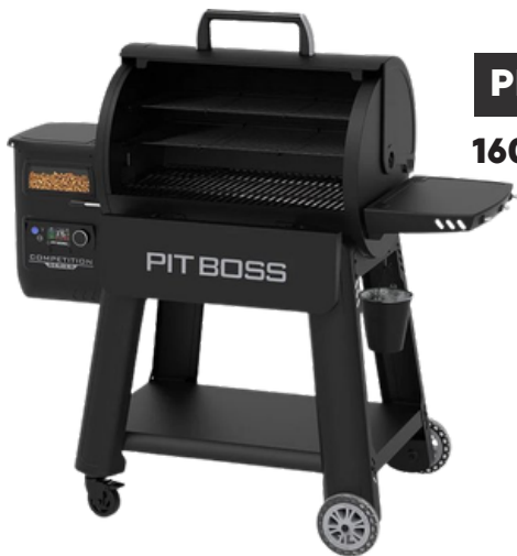
PELLET GRILL 1600 COMPLETE