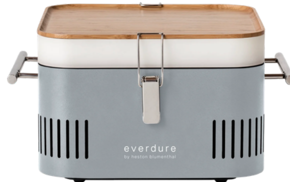
BBQ CUBE 38 X 32 X 22 CM