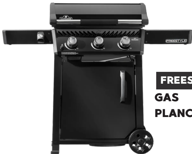
FREESTYLE GAS PLANCHA 24