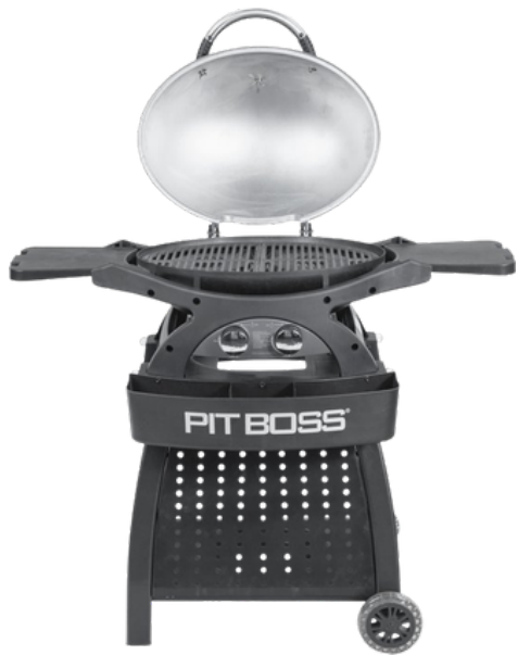
PIT BOSS SPORTSMAN 2 BURNER