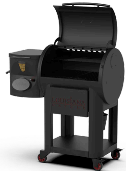
LOUISIANA GRILL 800 FP HOUTPELLET PELLET GRILL