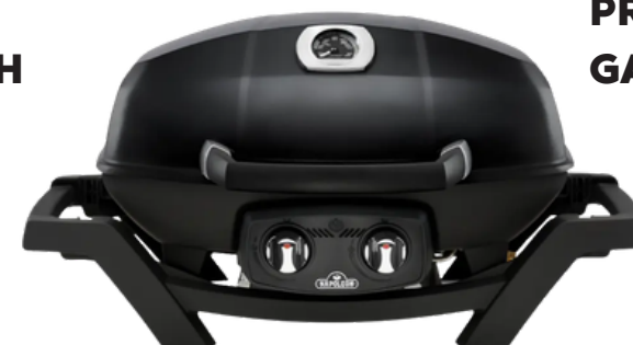
TRAVELQ PRO285 GAS