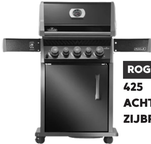
ROGUE 425 ACHTER & ZIJBRANDER