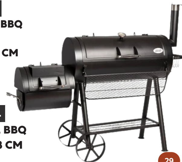
TEXAS GRILL HOUTSKOOL BBQ 126 X 72 X 138 CM