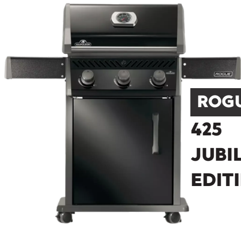
ROGUE 425 JUBILEUM EDITIE