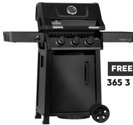
FREESTYLE 365 3 BRANDER