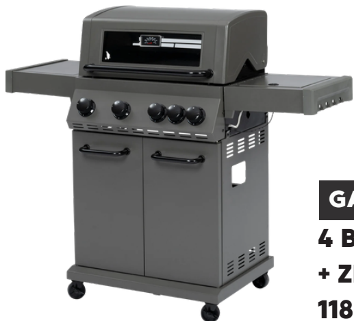
GAS BARBECUE 4 BRANDERS + ZIJBRANDER 118 X 56 X 140 CM