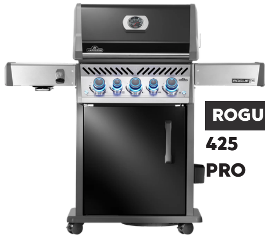
ROGUE 425 PRO