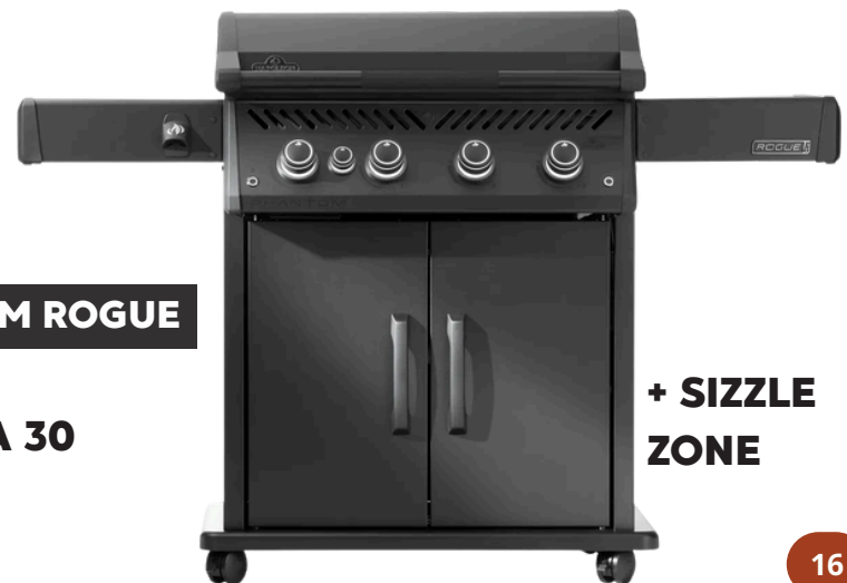
+ SIZZLE ZONE