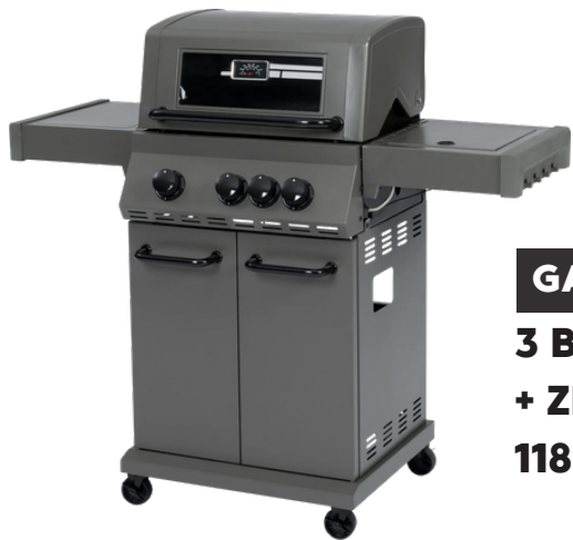
GAS BARBECUE 3 BRANDERS + ZIJBRANDER 118 X 56 X 133 CM