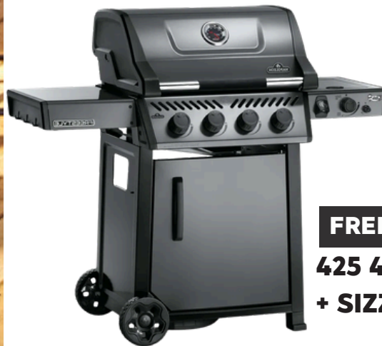
FREESTYLE 425 4 BRANDER + SIZZLE ZONE