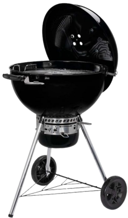
MASTER TOUCH PREMIUM