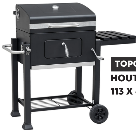
TOPGRILL HOUTSKOOL BBQ 113 X 64 X 107 CM