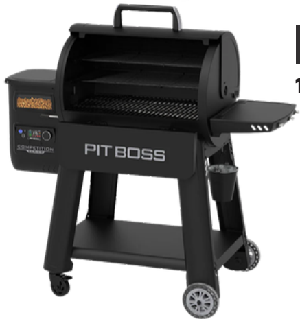
PELLET GRILL 1250 COMPLETE