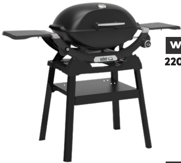
WEBER Q 2200N MET STAND