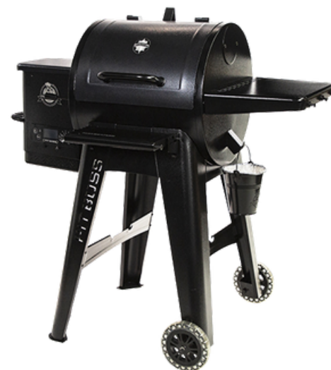
HOUTPELLET Navigator 550