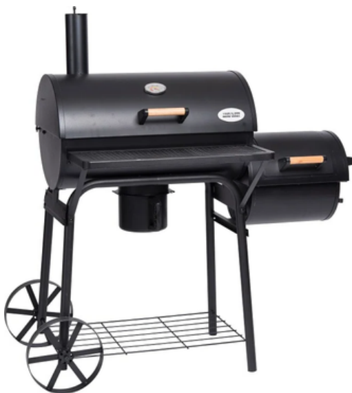
TEXAS GRILL HOUTSKOOL BBQ + ROOKOVEN 155 X 78 X 132 CM