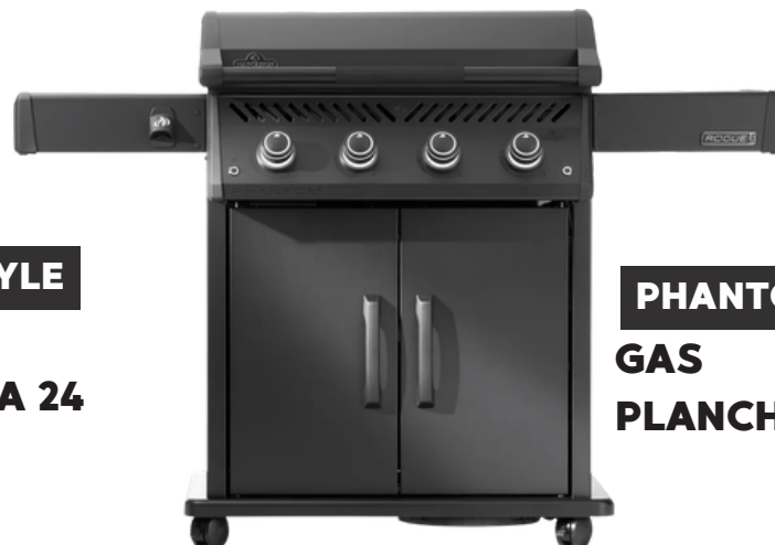
PHANTOM ROGUE GAS PLANCHA 30