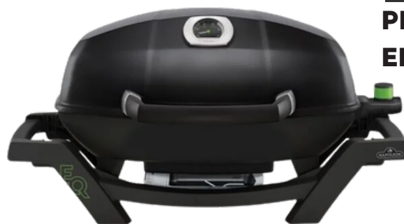
TRAVELQ PRO285E ELEKTRISCH