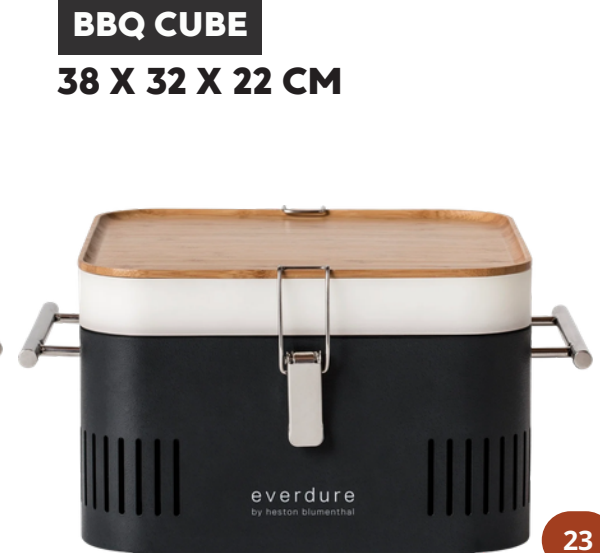
BBQ CUBE 38 X 32 X 22 CM