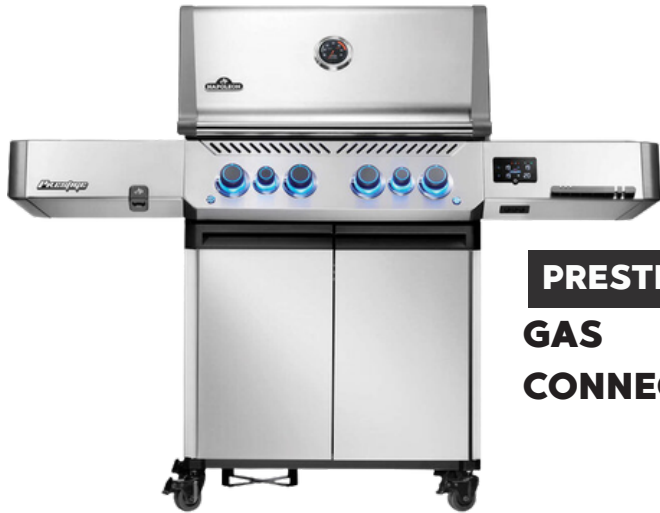
PRESTIGE 500 GAS CONNECTED