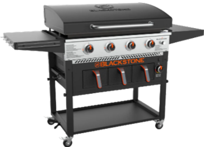
GRILL MET AIRFRYER 91 CM