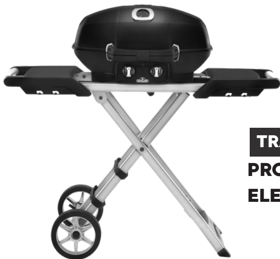
TRAVELQ PRO285 ELEKTRISCH