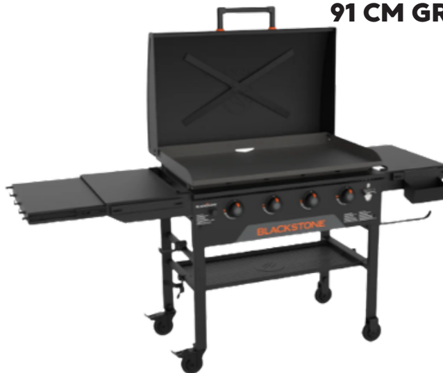
ORIGINAL 91 CM GRILL