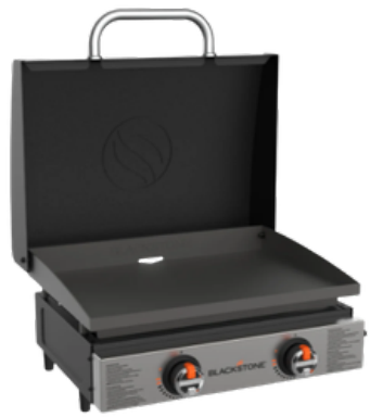
TABLE TOP GRIDDLE 55 CM