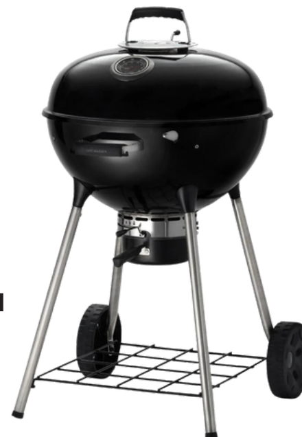
KETTLE HOUTSKOOL 59 X 71 X 94 CM