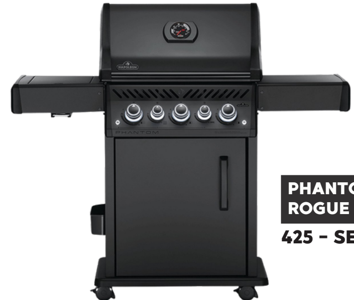
PHANTOM ROGUE 425 - SE