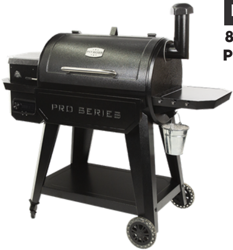
PELLETGRILL 850 HOUTPELLET PIT BOSS PRO