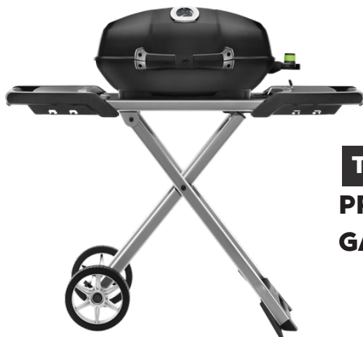
TRAVELQ PRO285 GAS