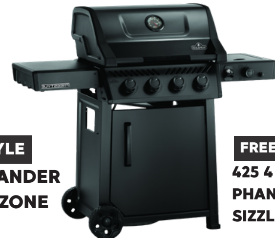
FREESTYLE 425 4 BRANDER PHANTOM + SIZZLE ZONE