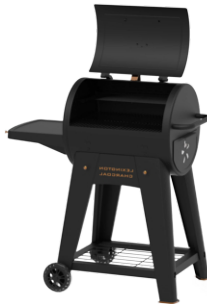
LEXINGTON GRILL HOUTSKOOL