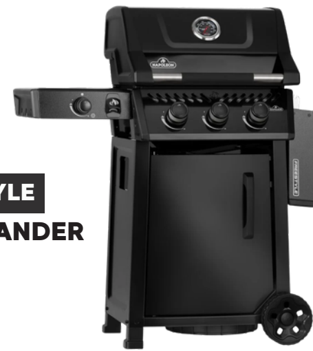
FREESTYLE 365 3 BRANDER + ZIJBRANDER