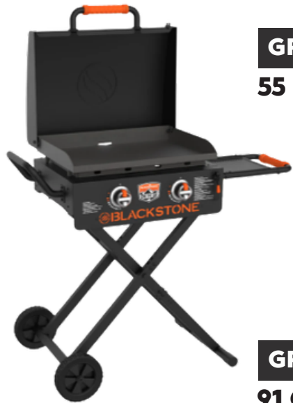
GRIDDLE ON THE GO 55 CM