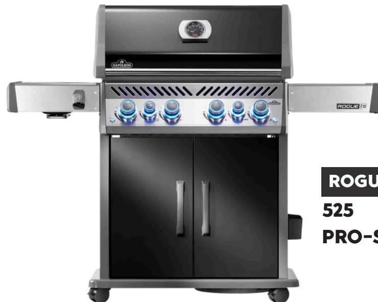
ROGUE 525 PRO-S