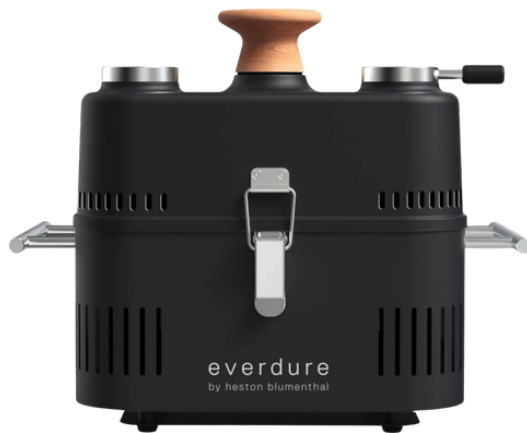
BBQ CUBE 42 X 35 X 34 CM