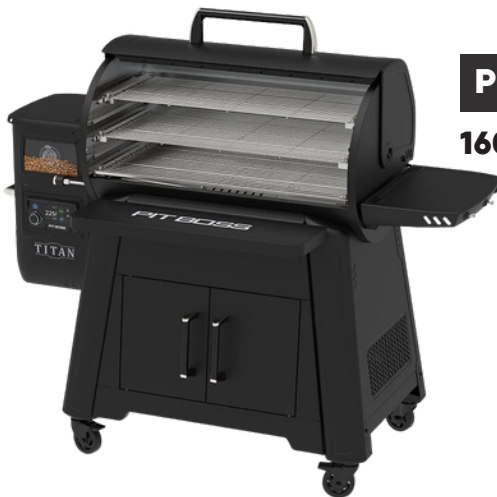
PELLET GRILL 1600 COMPLETE TITAN