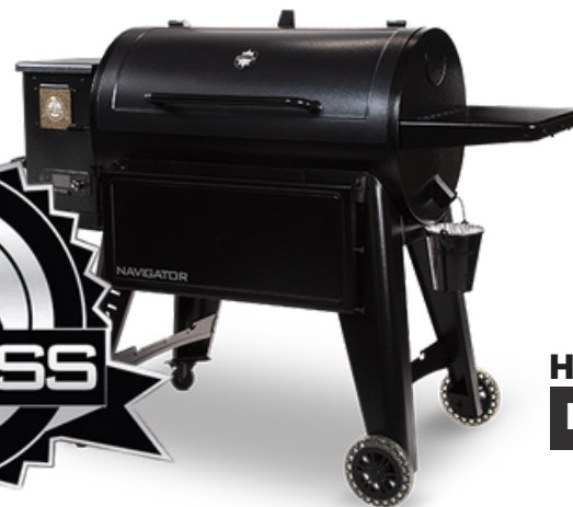
HOUTPELLET Navigator 1150