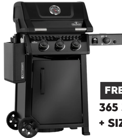
FREESTYLE 365 3 BRANDER + SIZZLE ZONE